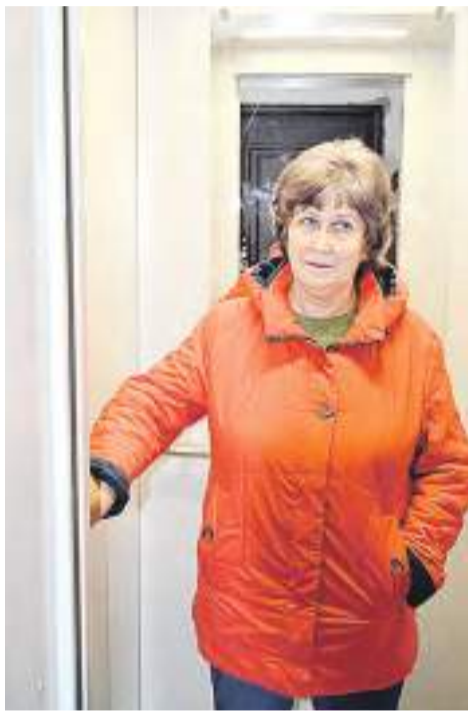
Жители очень рады новым лифтам.

Первое, что бросилось в глаза – современная, красивая кабина с удобными кнопками управления и табло индикации этажа. Также мы отметили бесшумность и плавность хода, до девятого этажа новый лифт довез нас за считанные секунды без толчков и рывков. И это закономерно – при производстве лифтов использовались самые передовые и инновационные