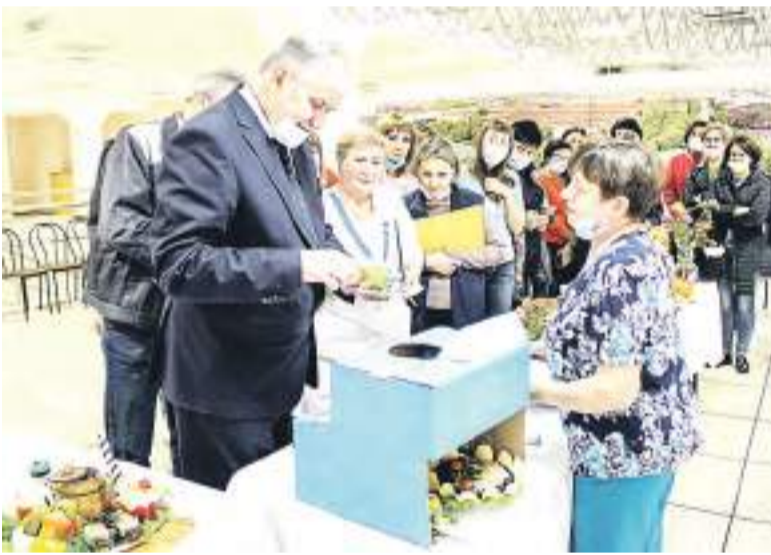
Процесс «приготовления» салата в «чудо-печке».