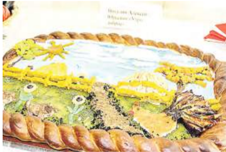
Закусочный пирог с сытной нижней и сладкой верхней частями.