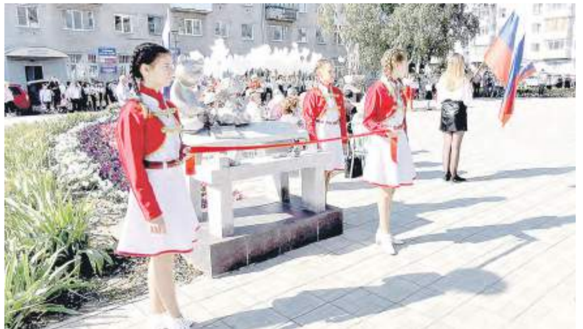
В торжественной обстановке состоялось открытие памятников.