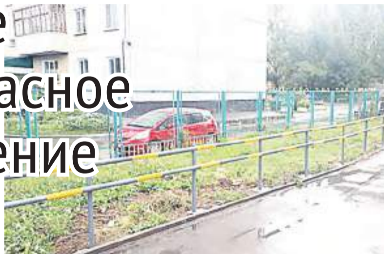
Рядом с библиотекой установлено перильное ограждение.

– Ограждения сделаны по ГОСТу, как положено. Это очень удобно для незрячих и слабовидящих, в том числе потому, что на перила нанесена специальная яркая светоотражающая пленка. Очень удобно, что ограждение идет от