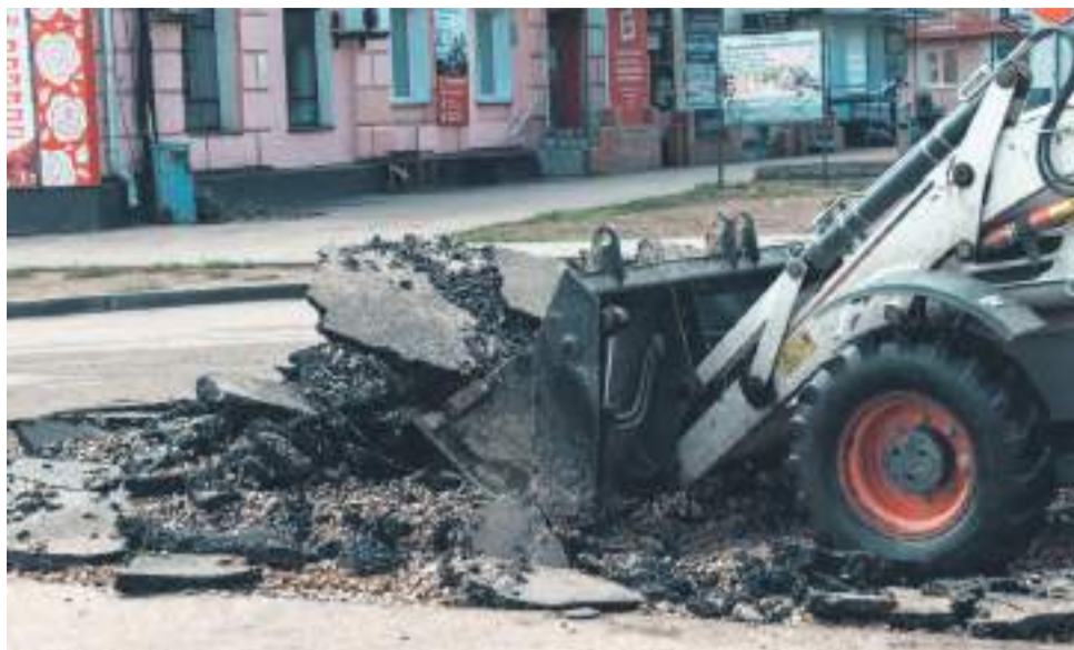
«Неправильный асфальт» демонтировали и уложили новый.

Когда ремонты на теплосети завершены, следующий важный этап – благоустройство участка. Восстановление ландшафта до исходного состояния «до ремонта» – такая же обязанность Сибирской генерирующей компании, как и монтаж трубопровода, и подача ресурса. После того как монтаж трубопровода был закончен, работники специализированной дорожно-строительной компании «Циркус» приступили к восстановлению асфальта. Специалисты не учли погодные