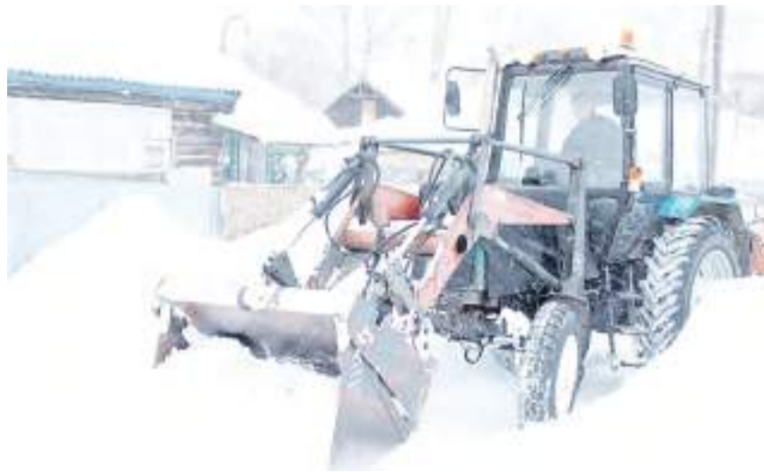
Идет расчистка улиц.