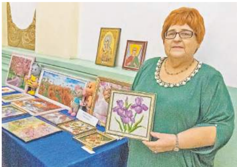
В фойе работала выставка декоративно-прикладного творчества.