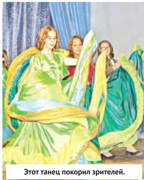
Этот танец покорила зрителей.

«Немцы» из лицея «Эрудит» тоже рассказали