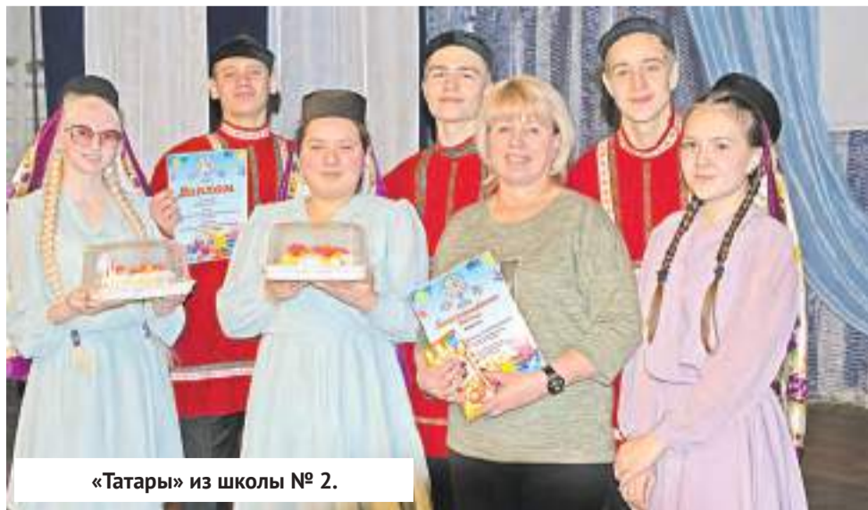
«Татары» из школы № 2.