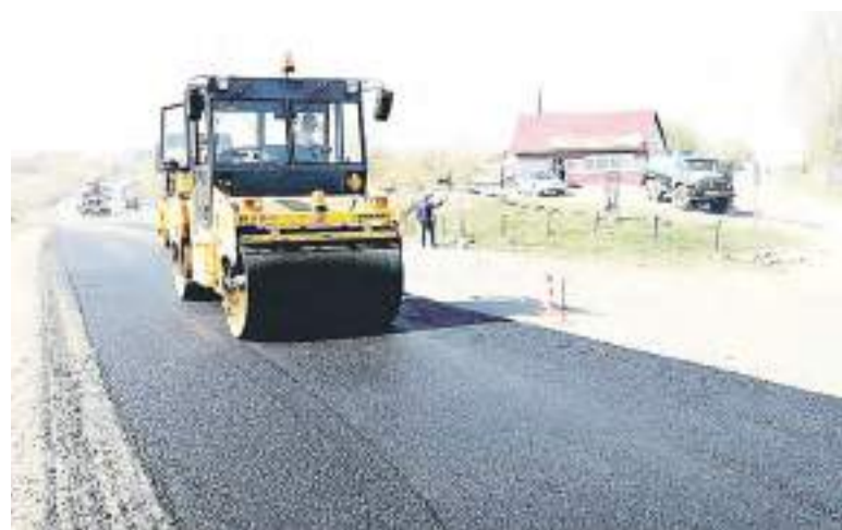
Ремонт автодороги «Бийск – Мартыново – Ельцовка – граница Кемеровской области».

В рамках реализации программы по ликвидации аварийных уникальных мостовых сооружений протяженностью более