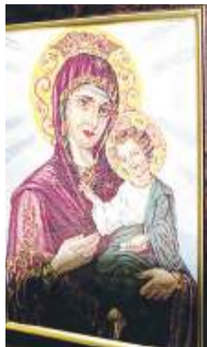
Вышитая бисером икона.

– А я предпочитаю вышивку лентами, так как картины получаются наиболее реалистичные, как живые. Попробовала свои силы лет восемь назад. Увидела работы, выполненные умельцами, и «за-