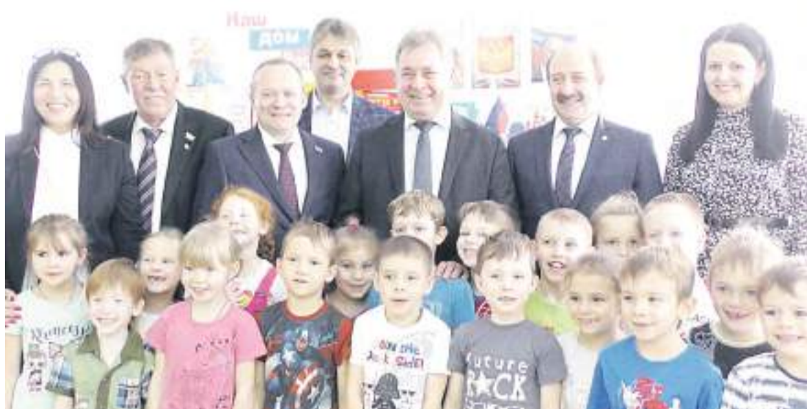
В гостях у «Жар-птицы».

Председатель АКЗС посетил и Рубцовский драматический