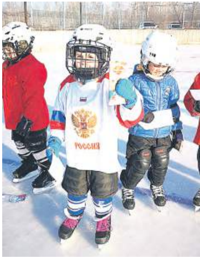
Первые успехи – первые награды.