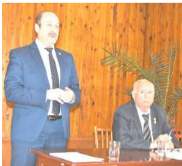
Выступает Глава города Дмитрий Фельдман.