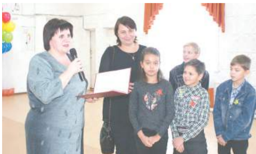
Для замещающих семей провели праздник, посвященный Дню матери.

Праздничная программа, подготовленная сотрудниками Детско-юношеского центра при финансовой поддержке Администрации города, получилась яркой и увлекательной. Ребята с интересом участвовали в конкурсах, в ходе которых благодарили своих мам и бабушек за любовь и заботу.