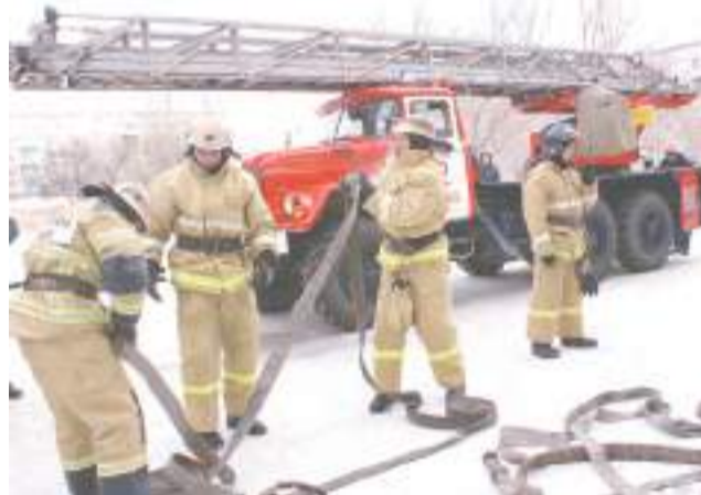
Пожар локализовали в считанные минуты.

В учениях участвовали сотрудники МЧС и скорой медицинской помощи, полицейские и спасатели ГОЧС. Всего было задействовано 18 человек лич-