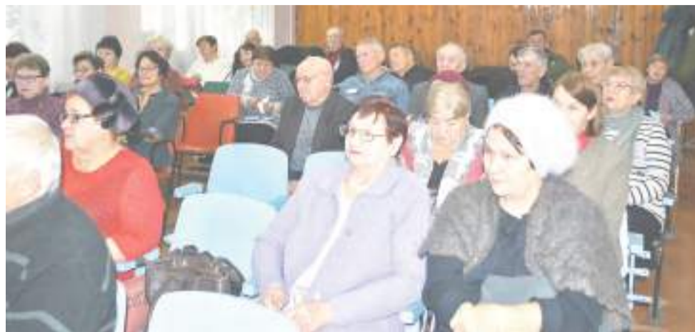
Ветераны Рубцовска – люди неравнодушные.

С темпами роста больше 100 процентов (то есть лучше, чем в прошлом году) отработали «Уралвагонзавод», Рф «Алтайвагон», «АСМ-запчасть», Рубцовский молочный завод («Вимм-Билль-Данн»), Швейная фабрика, РЗЗ. Меньше продукции, чем в прошлом году, произвели Рубцовский хлебокомбинат (как известно, ситуация была критической, но сейчас она выравнивается), Рубцовский мясокомбинат, «Литейный комплекс ЛДВ», Рубцовская типография, «Рубцовское предприятие «Рассвет». Далее Глава города рассказал об инвестициях, ремонте драматического театра, восстановлении канализационного коллектора, строительстве ледовой арены. Приятной новостью для участников