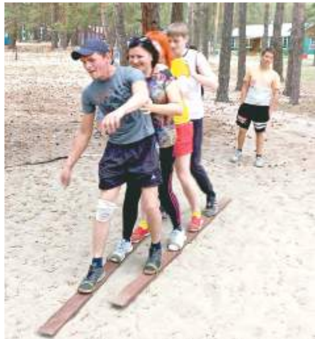
Идёт весёлая эстафета.

Газета «Местное время» – общественно-политическое издание. Зарегистрировано Управлением Федеральной службы по надзору в сфере связи, информационных технологий и массовых коммуникаций по Алтайскому краю и Республике Алтай (серия ПИ № ТУ22-00726 от 24 июля 2018 г.). Учредители: Администрация муниципального образования город Рубцовск, Управление печати и массовых коммуникаций Алтайского края.