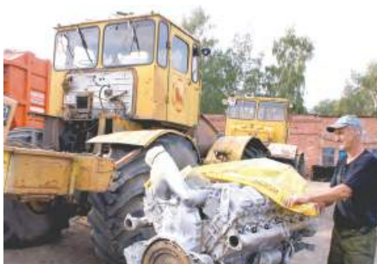
Сотрудники «АвтоСпецТехники» готовят машины к предстоящей зиме.

Предприятие работает по заявкам, которые поступают от управления ЖКХ и экологии на осно-