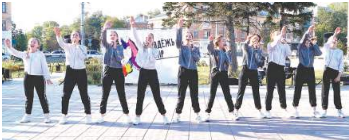
Творческие коллективы исполнили номера о мире и добре.