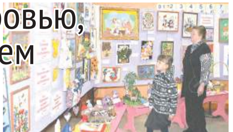
Посетители выставки с восторгом рассматривали работы.