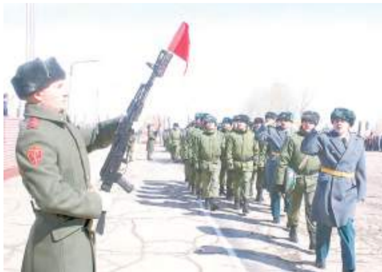
В день празднования годовщины образования части в Рубцовске прошло несколько мероприятий.