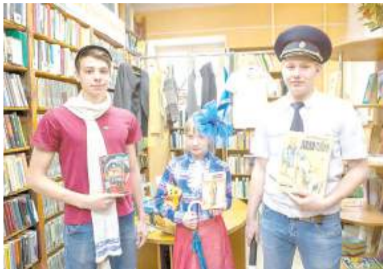
Молодежь в образе персонажей литературных героев.