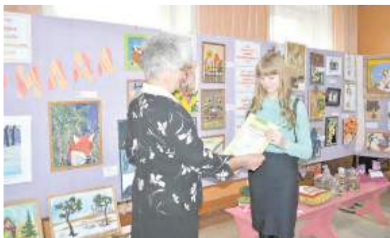
Церемония награждения авторов лучших работ.