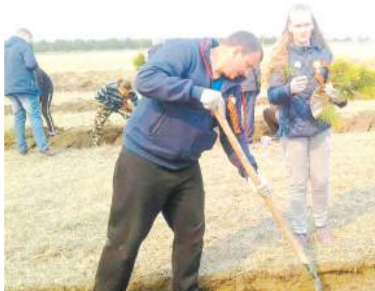
Участники акции посадили семь тысяч саженцев.

Ирина ЖУКОВА