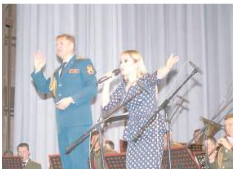
Перед рубцовчанами выступила заслуженная артистка Малика Разакова.