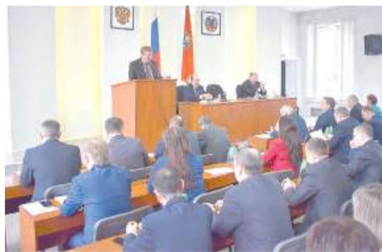
Рабочий момент сессии.

Администрации города было предложено взять эту проблему на ежедневный контроль. И