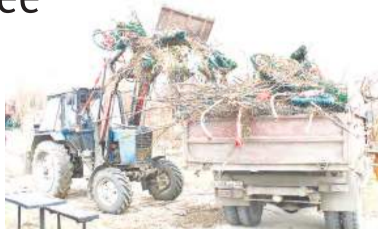
Весь мусор вывозится на полигон.

Ежегодно весной, обычно перед Радоницей, каждый человек старается привести в порядок могилы своих родных и близких, убирает скопившийся на территории кладбища за зиму мусор: венки и искусственные цветы, кресты и оградки, сломанные ветки деревьев и бутылки. Только не все вывозят его на предназначенные для этого места. В результате появляются огромные свалки. И некоторые участки городского погоста предстают взору в весьма неприглядном виде. Такой объем работы