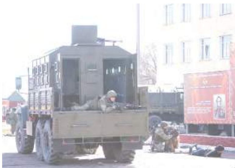
Военнослужащие полка продемонстрировали боевые навыки.