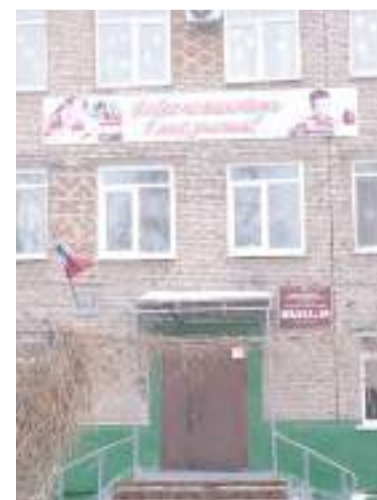
В школе № 15 заменили 68 окон.