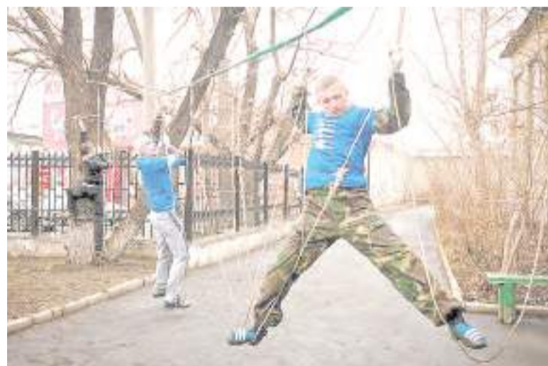
Мобильный фрироуп – скоро в СОШ № 18.

На реализацию проекта «Школьный скалодром» МБОУ «СОШ № 10 «Кадетский корпус юных спасателей» необходимо 730 000 рублей, педагогический коллектив и родительская общественность планируют привлечь