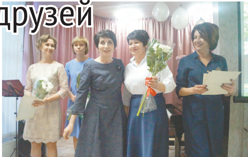
На встрече дарили подарки и чествовали лучших работников.

которые на протяжении многих лет здесь собирались, бережно хранились. Дело, конечно же, в людях. За 95 лет библиотека вошла в жизнь как сотрудников, так и огромного количества читателей, всех, чья жизнь не мыслима без книг и без чтения. Самым активным читателям и участникам различных программ и проектов на вечере вручили читательские билеты.