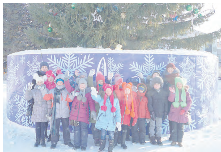
Ученики поспелихинской школы №3 у новогодней ёлки.