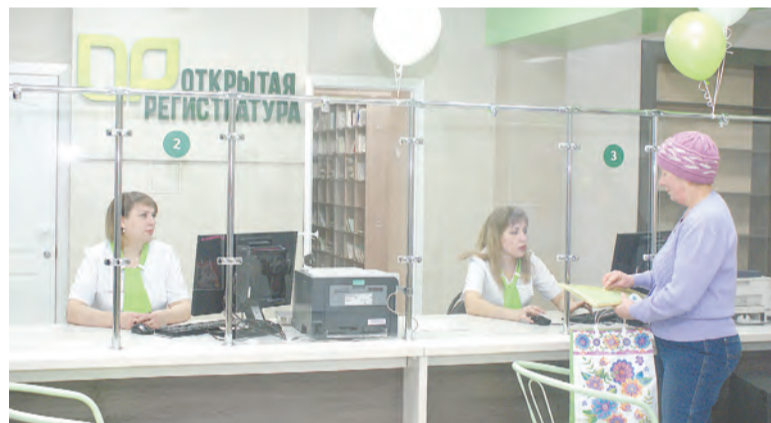
В поликлинике заработала «Открытая регистратура».

Поликлиника горбольницы № 1 в числе других медицинских учреждений Алтайского края приступила к реализации проекта «Бережливая поликлиника». Главной целью проекта является повышение доступности и качества медицинской помощи.