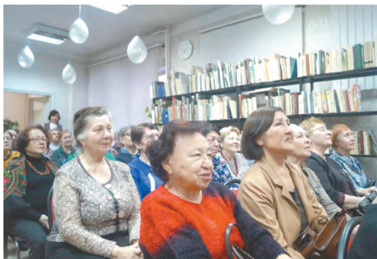
В зале давние друзья библиотеки.

Татьяна МЕЛЬНИКОВА