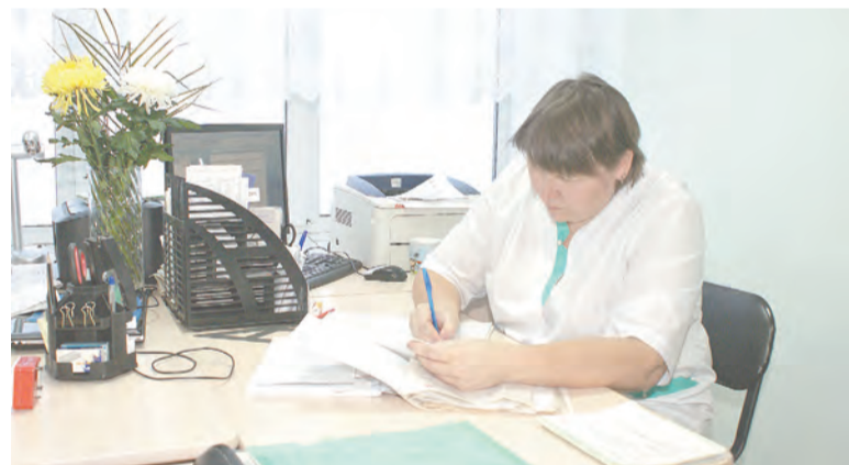
Врачи приступили к приёму пациентов.