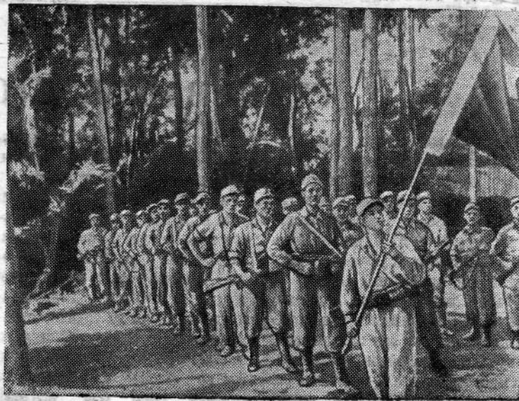
Малайский народ самоотверженно борется за свободу и независимость своей родины. Крепнут ряды бойцов Национально-освободительной армии Малайи, растет их воинское мастерство. На снимке: воинская часть Малайской Национально-освободительной армии.

МОНТЕВИДЕО. Как сообщает уругвайская газета «Хустисия», в Монтевидео состоялась забастовка рабочих металлургических предприятий. В забастовке приняли участие 15 тысяч человек. Бастовавшие требовали восстановления на предприятиях уволенных рабочих и повышения заработной платы.