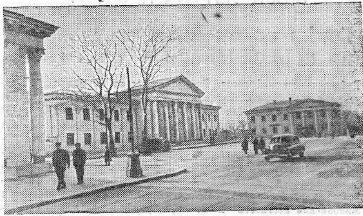
КИЕВСКАЯ ОБЛАСТЬ. Растет и хорошеет старинный город Переяслав-Хмельницкий, где 300 лет тому назад было принято решение о воссоединении Украины с Россией.

На снимке: новая площадь в центре города.