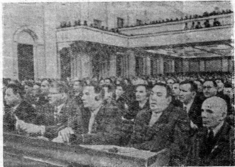
XXI съезд КПСС. В зале заседаний Большого Кремлевского дворца.

А. А. Громыко отметил, что Советский Союз прочно захватил инициативу в международных делах и выступает с мирными пред-