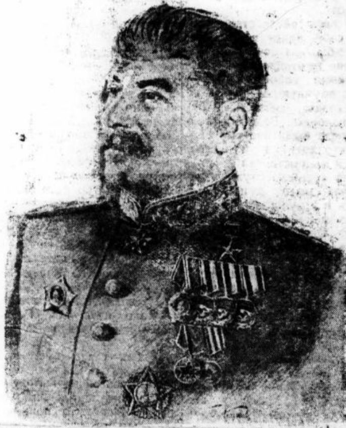
В помощь избирателю

3 декабря в сталелитейном цехе состоялся митинг, посвященный обращению чугунолитейщиков. Принято обязательство закончить 30 декабря месячную производственную программу.