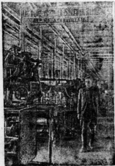
Восстановленный и пущенный ткацкий цех Рижской шелковой фабрики „Ригас-Аудумс“

С большим интересом слушала молодежь разъяснение директора завода о перспективах развития завода и роста производства.